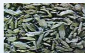
活性炭（間伐材利用）